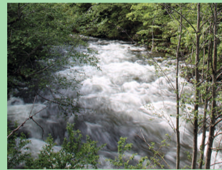
На стр. 3