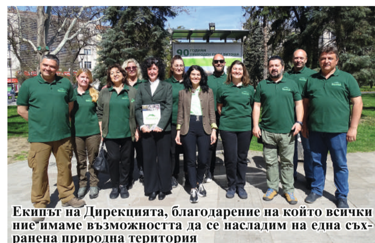
Екипът на Дирекцията, благодарение на който всички ние имаме възможността да се насладим на една съхранена природна територия