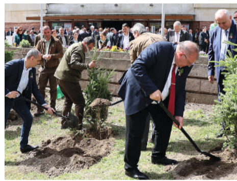
В символичното залесяване се включиха официалните лица и наградените лесовъди

Първия ден от празничната Седмица почетоха директорите на шестте държавни предприятия и техните подразделения, регионалните дирекции по горите, дирекциите на природните паркове,