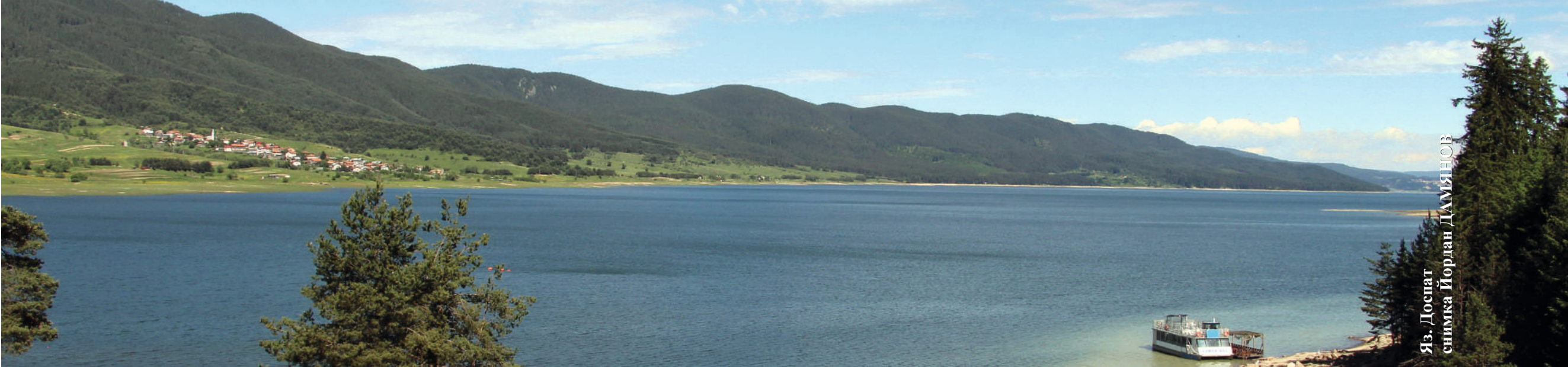
Яз. Доспат