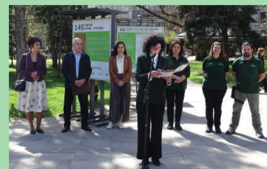
На стр. 8