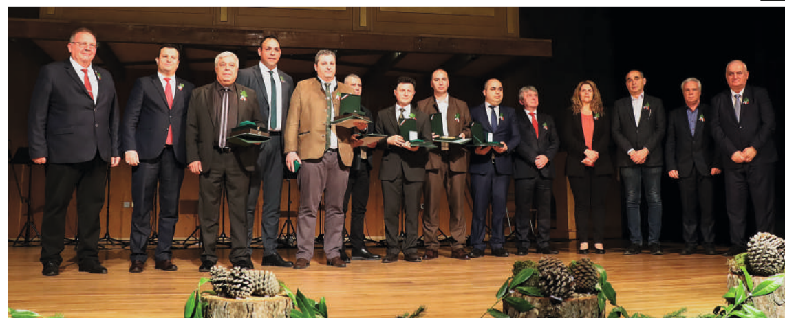
Наградените лесовъди с официалните гости на тържеството