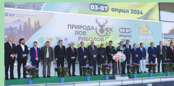
На стр. 5