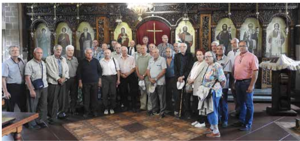
На посещение във военната църква „Св. Иван Рилски“ в Кресна