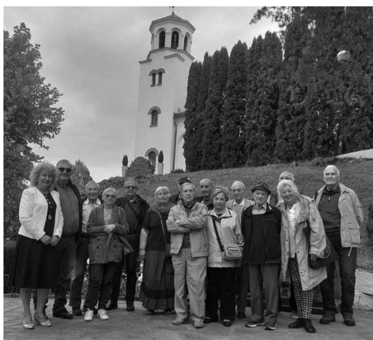
Участници в срещата пред Клисурския манастир

Председателят на Съюза на лесовъдите в България проф.