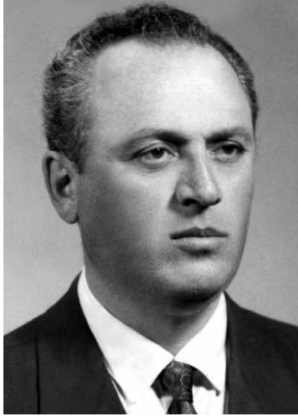
През 1956 г. по негово желание постъпва в ГС - гр. Исперих, като