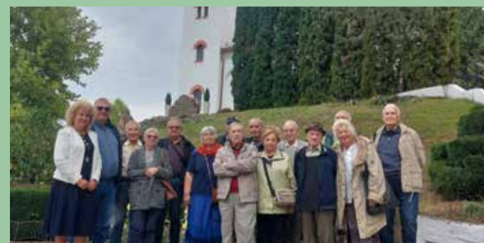
На стр. 2

Дружеството на лесовъдите ветерани от София на посещение в УОГС „Петрохан“ - с. Бързия