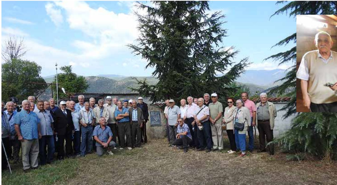
Ветераните пред паметната плоча „80 г. ДГС - Кресна“