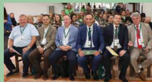
На стр. 1-8

България бе домакин на XVIII Европейски конгрес по горска педагогика