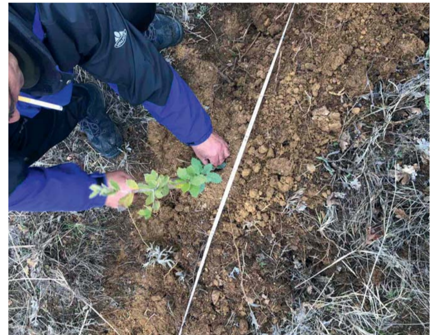
Залесяване със сухоустойчиви дървесни видове в Държавните горски стопанства - Петрич, гр. Сандански и гр. Гоце Делчев