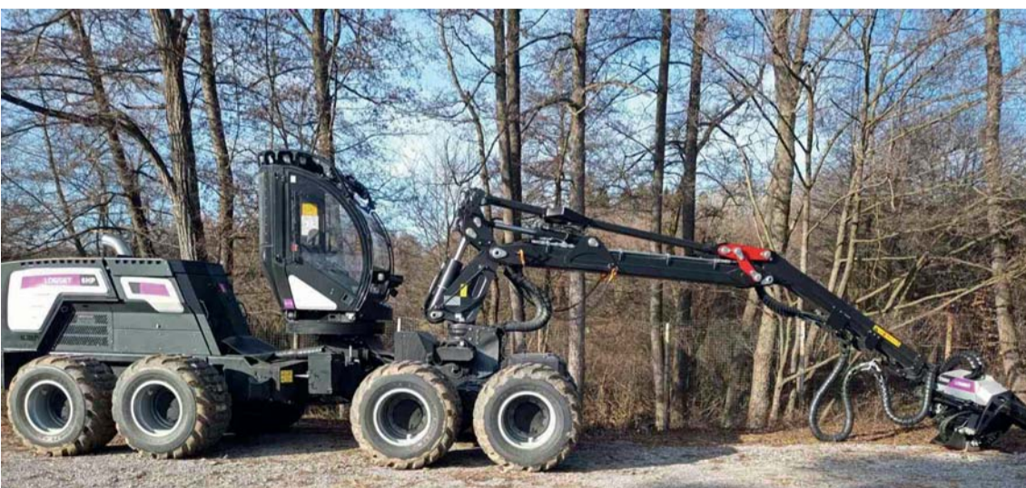
Харвестерна система за отгледни сечи

ОП „Околна среда 2014 - 2022 г.“ на МОСВ.