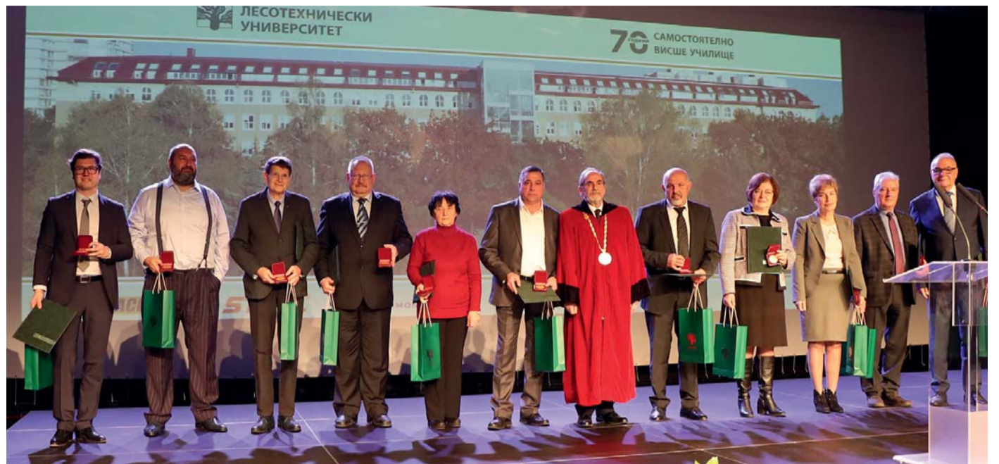
Носителите на „Почетен знак“ на ЛТУ