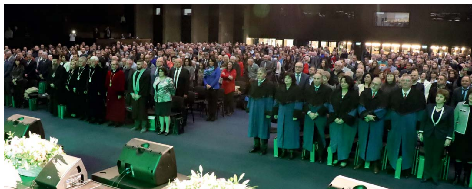
Участници в тържеството