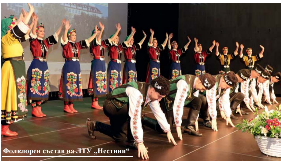
Фолклорен състав на ЛТУ „Нестини“