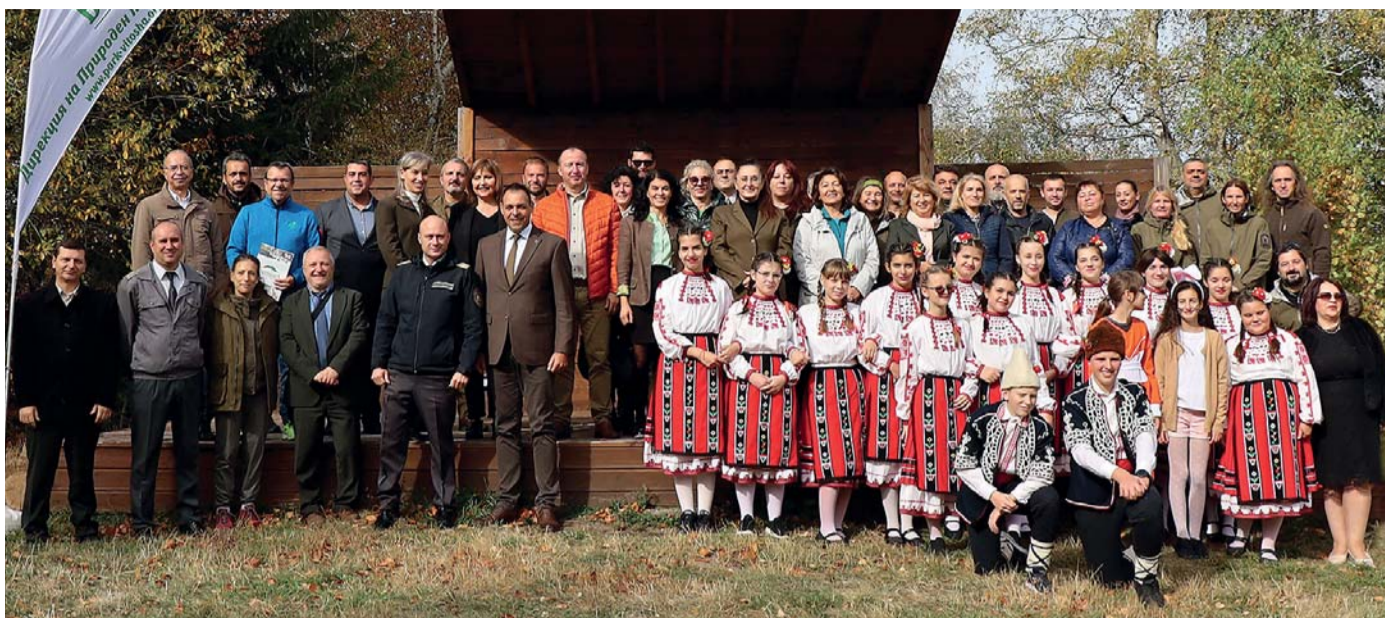
Домакини, гости и учениците от 191 ОУ „Отец Паисий“ в с. Железница отбелязаха заедно годишнината на Природния парк