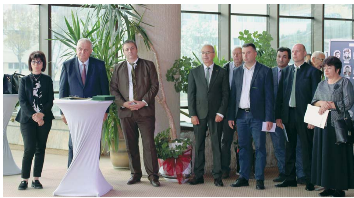
Официалните гости на тържеството