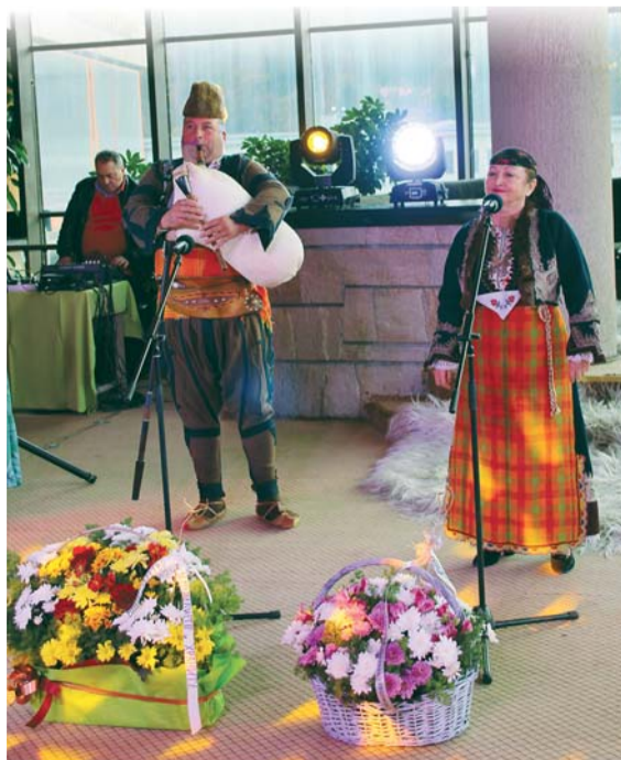
Началото на тържеството с родопски песни за гората

На 31 октомври колективът на Държавното горско стопанство в Смолян - териториално поделение на Южноцентралното държавно предприятие - Смолян, отбеляза годишнина-